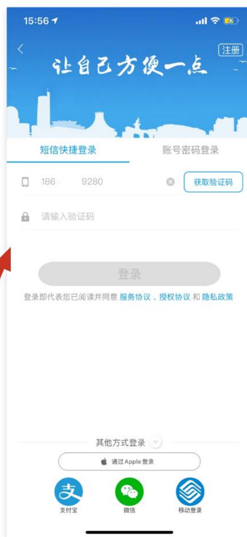
②登录注册后进行实名认证